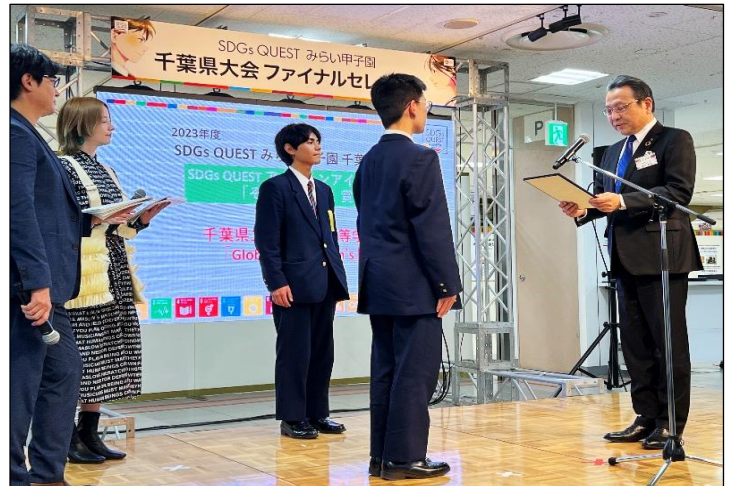
「そごう千葉店賞」を受賞した県立幕張総合高等学校