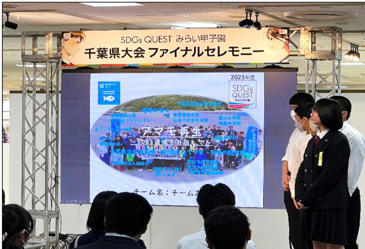
「アマモの再生」について発表する千葉県立安房高等学校

「SDGs QUEST みらい甲子園」とは、高校生が持続可能な地球の未来を考え行動するために、社会課題の解決に向けたアイデアを考える機会を創発し、そのアクションアイデアを発表・表彰する大会として、2020年より全国各地で開催されています。千葉県においては昨年の首都圏大会から独立し、本年初めて千葉県大会を開催。43チームがエントリーし、選考を通過した12チームが3月20日(水・祝)にファイナリストとしてアイデアを発表しました。そごう千葉店は協賛施設として、一般の方にも観覧いただける会場を提供。また、「そごう千葉店賞」の協賛も行い、高校生の皆さまを応援しました。