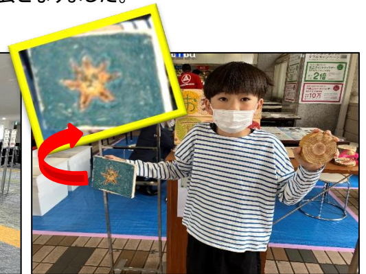
イベント終了後に完成品をご披露