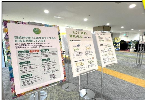
西武所沢S.C.の取り組みをパネルでご紹介