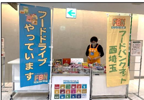
フードドライブでは多くのお客さまにご協力いただき、29 kgの食料品が集まりました