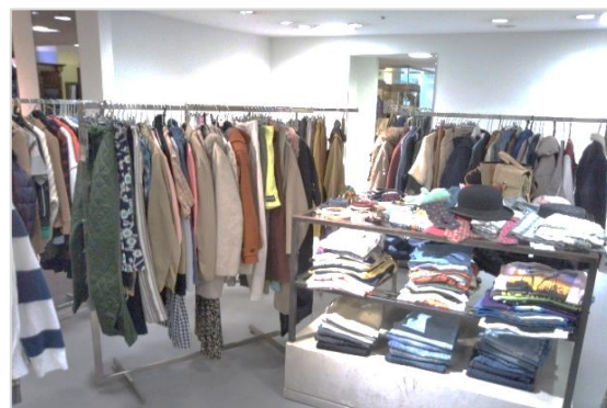
婦人服・紳士服・雑貨等約200点を展開