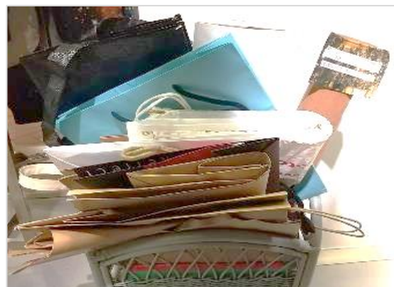
不要なショッパーも循環