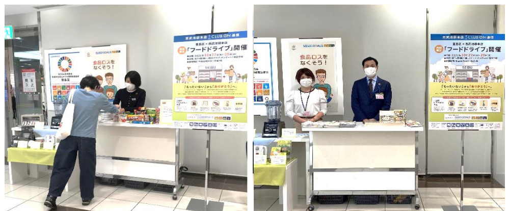
西武池袋本店 地下1階＝南口クラブ・オンゲートに受付を特設