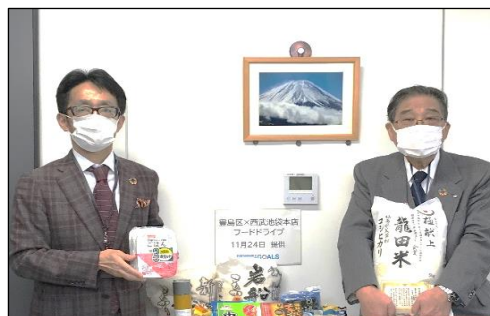
豊島区民社会福祉協議会 感謝状贈呈式