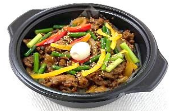
お取引先さまにもご協力いただき代替肉を使用したオリジナル惣菜を販売