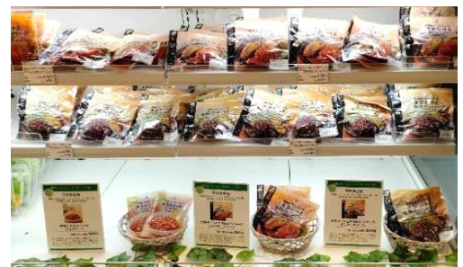
セブンプレミアム売場では大豆ミートを使用した3種類の商品をクローズアップ