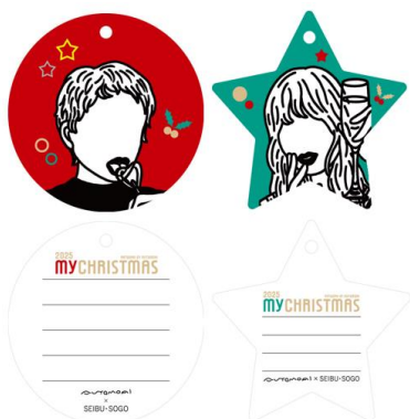
オーナメント型メッセージカード(無料)