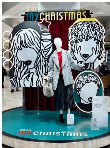
そごう大宮店VP装飾