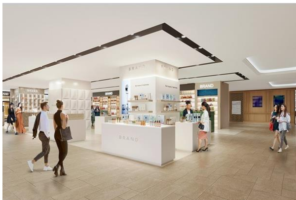
1階フレグランス イメージ

玄関口となる1階フロアには、5つの大型インターナショナルブティックと10のフレグランスブティックが出店し、西武池袋本店の「顔」となるゾーンをかたち作ります。近年「自分を表現するアイテム」として顕著なニーズの高まりを見せるフレグランスについては、香りを得意とするブランドがブティック形式でショップを構え、関東最大級 300 m 2 のフレグランスゾーンを形成します。ご自分だけの香りを見つけることはもとより、ここでしか出会えない香りをお選びいただけます。