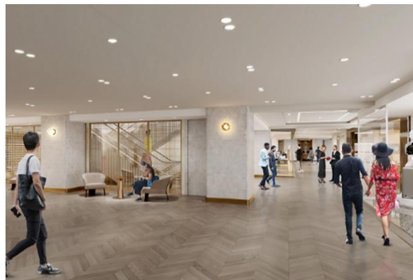
4階インターナショナルブティック イメージ