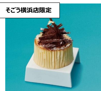
そごう横浜店限定