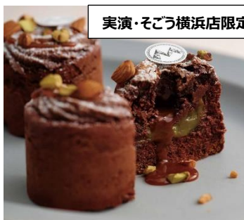
実演・そごう横浜店限定