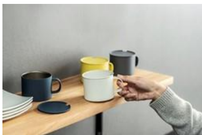
ステンレスマグ／ピーコック魔法瓶 工業株式会社／3,300円