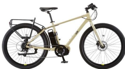
電動アシスト自転車 ログアドベンチャー e 株式会社あさひ (展示のみ)