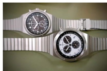
RECORD LABEL 1984 chronograph シチズン時計株式会社 (展示のみ)