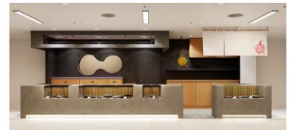
分 根津松本 鈴イメージ

東京・文京区根津にある鮮魚店「根津松本」からのれん分けした「分 根津松本 鈴」が百貨店初登場。こだわりの旨い魚を詰めた海苔弁当なども展開し、デパ地下ならではのグルメなお客さまにもご満足いただけるクオリティでお応えします。