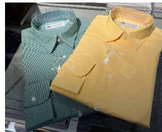
フェアファックス「ショートカラーシャツ」