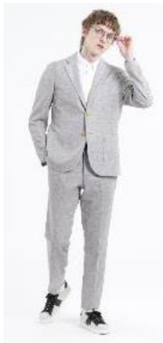
マッキントッシュ フィロソフィー 「カラミ織りセットアップ」