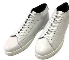
アリスト「レザースニーカー」