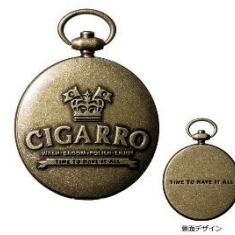
シガーロ「ソリッドパフューム」