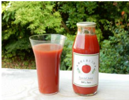
トマトジュース(180ml)／330円(神奈川県)