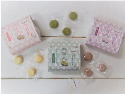
三盆丸、茶葉丸、小豆丸(米粉クッキー、各10個入)／410円(埼玉県)