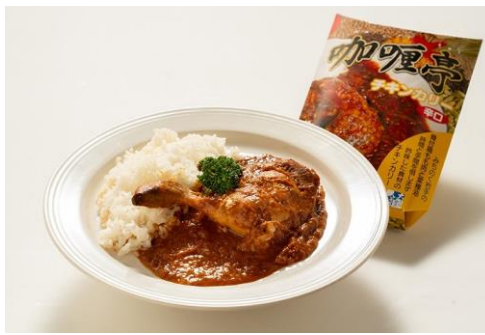
チキンカレー(300g)／864円(岩手県)