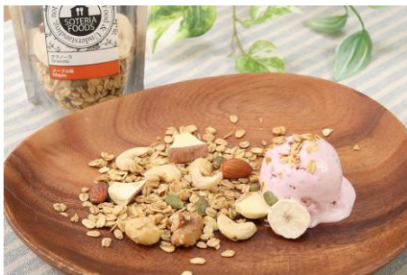
ソテリアグラノーラ メープル(150g)／756円(東京都)