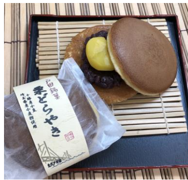
栗どらやき(1個)／210円(埼玉県)