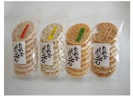
自然食ポンせん各種／216円(静岡県)