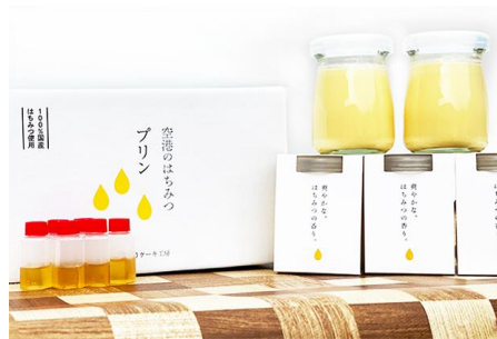
はちみつプリン(1個)／540円(島根県)