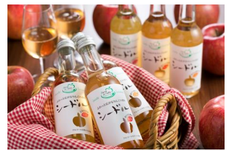
シードル(250ml)／486円(岩手県)