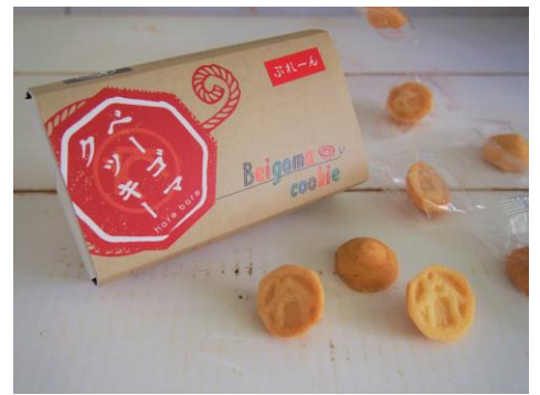
ベーゴマクッキー プレーン(12個入)／400円(埼玉県)