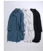
MB ハイエンド DSKE シャツ 24,500円

名前: MB オリジナルブランド: MBアイテム アイテムジャンル: アパレルファッション YouTube チャンネル: MBチャンネル/登録者数: 31.8万人 https://www.youtube.com/channel/UCagAVZFPcLh9UMDidIUfXKQ