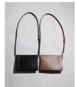
MB ハイエンドショルダーバッグ 29,000円