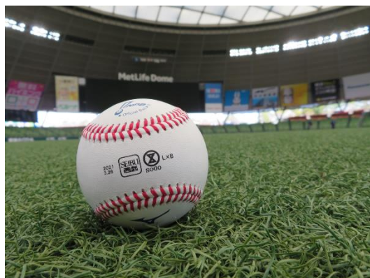
統一試合球 デザイン