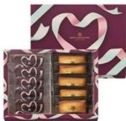
■アンリ・シャルパンティエ/フィナンシェ 2種詰合せS/1,782円 (店舗:そごう大宮店、 西武東戸塚S.C.を除く5店舗)