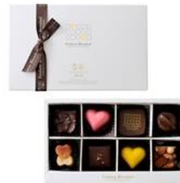
■フレデリック・ブロンディール /ビートゥーショコラ8コ/2,376円 (店舗:西武池袋本店、 そごう横浜店、千葉店、大宮店)