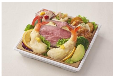
■柿安ダイニング /シェフ自慢のオードブル/1,501円 (店舗:西武渋谷店、所沢S.C.、 東戸塚S.C.を除く4店舗)