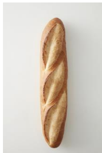
■ドンク/バターロール/314円 (店舗:西武渋谷店、東戸塚S.C.を 除く5店舗)