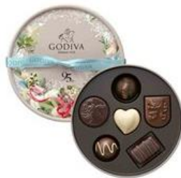
■ゴディバ/95周年アニバーサリー アソートメント(6粒入)/2,160円 (店舗:西武東戸塚S.C.を除く6店舗)