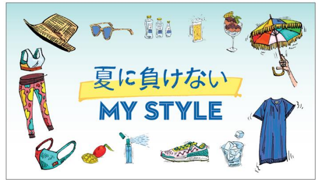
↑ e.デパートバナーデザインイメージ