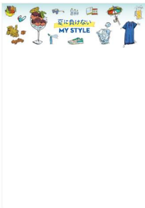
↑ 商品 POP(A3 サイズ)