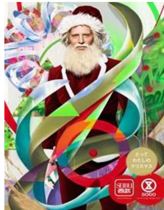
KOMESANNIN9 コメセンニンナイン