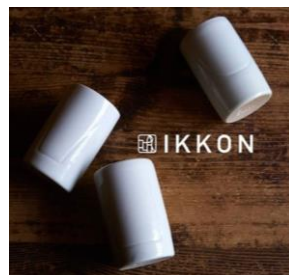
ぐい呑みセット /IKKON 税込 9,900 円