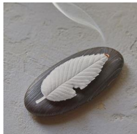
紙のお香 HA KO (はこ) / 薫寿堂 税込 418 円～