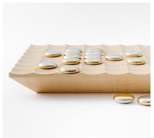
リバーシゲーム /Teyney さざ波 税込 9,900 円

※スマート補聴器について:販売は西武池袋本店9階メガネサロンにて承ります。充電器は別売りです。