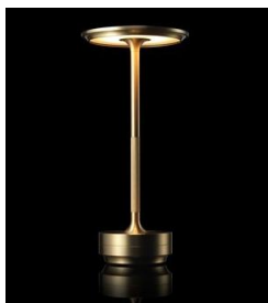
コードレスランプター /アンビエンテック 税込 46,200 円