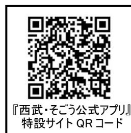
『西武・そごう公式アプリ』 特設サイト QR コード