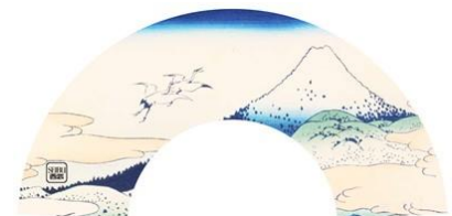
扇子デザインイメージ