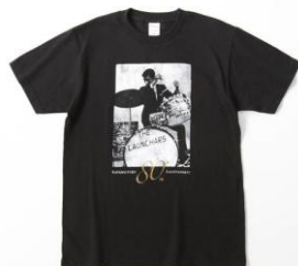
80th 記念 Tシャツ 3,000円 サイズ：S・M・L

イメージキャラクターには、80歳を迎えてなお最前線で活躍する加山雄三氏を採用。最新のクールビズに挑戦した感想や、父とのエピソードをご本人が語る肉声を各店内でお聞きいただけます。また、各店会場では、通常ライブ会場などでしか手に入らない生誕80周年記念グッズも数量限定で販売。