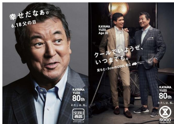
そごう横浜店では、6月11日(日)にトークショーを開催予定。