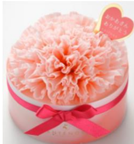
アンテノール／カーネーション 12cm2,700円、15cm3,780円 販売：西武池袋本店、そごう横浜 浜店含む7店舗