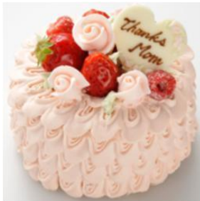
アニバーサリー／ブルーミング フラワーケーキ 9cm2,700円 販売：西武池袋本店のみ

母と娘2人で食べきれる3号サイズのホールケーキや、カーネーションモチーフなど2人で「かわいい！おいしい！」をシェアできるケーキを集めました。