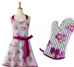
カーリーホーム／ エプロン6,048円、ミトン1,944円 販売：西武池袋本店、そごう横浜 浜店含む3店舗とe.デパート

2人で料理をする時のエプロンや、2人でゆっくりティータイムを過ごすための紅茶など、母と娘が楽しむためのアイテムを集めました。