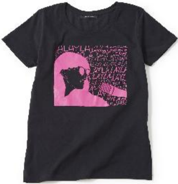
Tシャツ 3,800円 サイズ F / 綿 100%