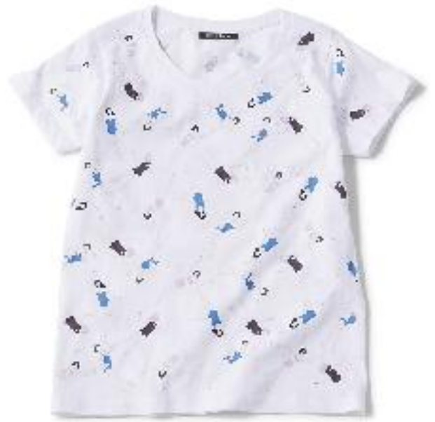
Tシャツ 4,200円 サイズ F / 綿 100%