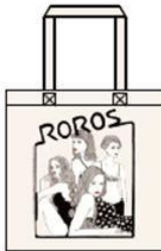
1,900円 綿 100%