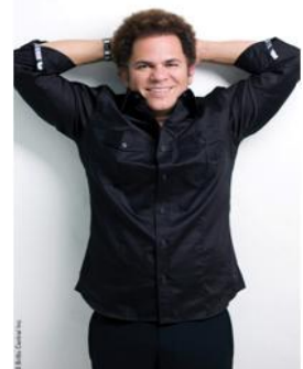
ロメロ・ブリット