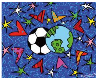
PELE AND THE WORLD (2006)