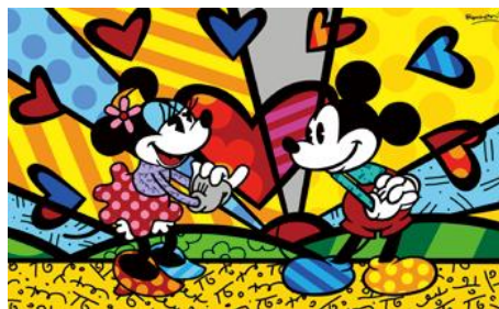
MICKEY'S NEW DAY (2013)

1963年ブラジルのレシフェ生まれ。マティスやピカソの作品に出会い、キュービズムとポップを融合させた鮮やかでアイコン的なスタイルを生み出す。ニューヨーク・タイムズは彼の作品をして「思いやりと楽天主義、愛に溢れた作品」と評している。