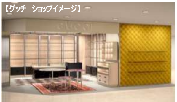
【グッチ ショップイメージ】

アレサンドロ・ミケーレが手掛けるドラマティックでフレッシュな魅力が満ちたバッグや革小物。グッチのレザーグッズショップがデビュー。西武池袋本店オープン記念限定品、アラバスク柄のカーフレザーをGGスプリームキャンバスの上に施した、「ミニチェーンバッグ」も登場します。