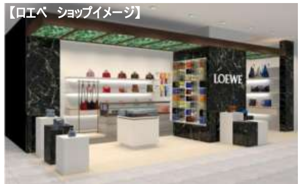
【ロエベ ショップイメージ】

クリエイティブディレクター、ジョナサン・アンダーソンが手掛ける、バッグや革小物などの最新コレクションを取り揃えた新ストアがオープン。限定特別カラー、エレクトリックブルーの「エレファントバッグ」も登場します。