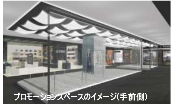
プロモーションスペースのイメージ(手前側)