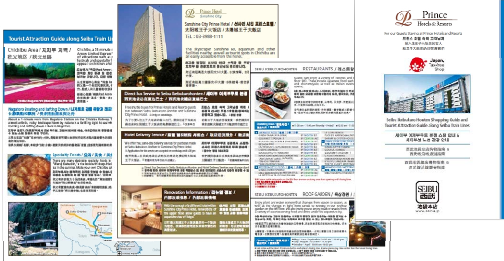
西武鉄道・プリンスホテル・西武池袋本店で作成のパンフレット ※イメージ