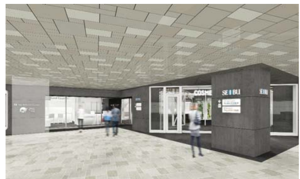
インバウンドコーナー・コスメアネックス