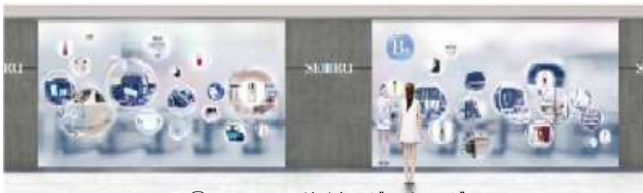
②ハーフミラーサイネージのイメージ

コスメアネックス側の壁面には、ハーフミラーサイネージを設置。「e.デパート」で購入可能な 92 ブランド・10,000 品目の商品情報を表示。加えて、通行者の興味を引き、役立つ情報として「天気予報」・「血液型占い」も盛り込みます。大小のシャボン玉が浮かんでいる中に情報が表示されるインパクトあるビジュアルで目を引き、商品申し込みのタッチパネルまで誘導します。