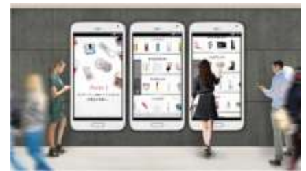
③タッチパネルのイメージ