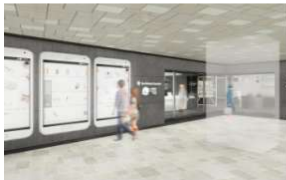
コスメアネックスの外観イメージ

コスメアネックスでは、20～30代女性の関心が高いブランドを集積。無添加化粧品、健康食品やサプリメントの展開で健康志向の女性に支持されるブランド「ファンケル」を北ゾーンから移設。スキンケアに加え、ニーズの高まる植物由来のヘアケアブランド「ジョンマスターオーガニック」を拡大移設。スキンケア～メイクのフルブランドとしてはナチュラル系で人気の「スリー」を移設。棚仕器のオープンな陳列により、目的買いやお急ぎの購入時の利便性を向上、ショートタイムショッピングニーズに応えます。