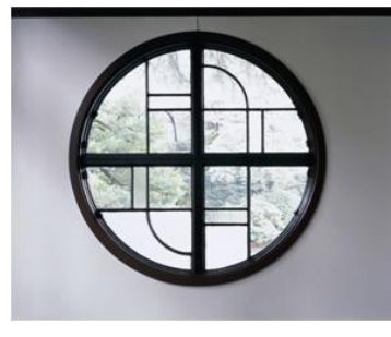
旧運転手控室 窓装飾