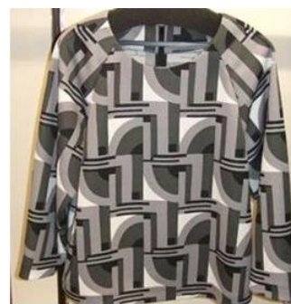
(レキップ)トップス