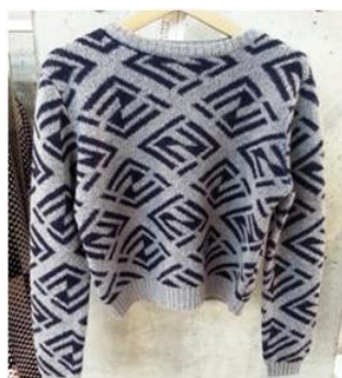
(リリシスト)ニット