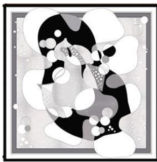
(マルフロイ)スカーフ