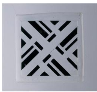
旧運転手控室 通気口