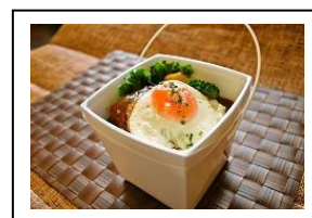
【お弁当】 ロコモコ丼 580円（1パック）