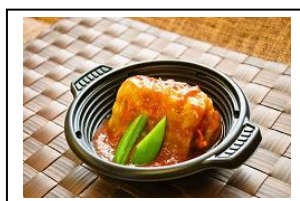
【定番レクメニュー】 黒毛和牛入りロールキャベツ 380円（1パック）