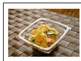
【サラダ】 自慢のポテトサラダ 280円（1パック）