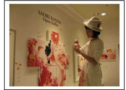
イケセイスティール コンテンポラリー展 ■3月13日(土)~23日(火)