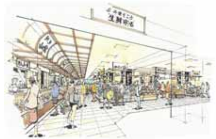
地階 千葉生鮮市場