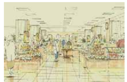
地階 ワールドスイーツ