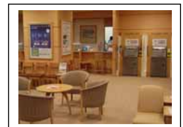
地階 ミレニアムカウンター