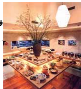
自然食バイキング 「はーべすと」イメージ