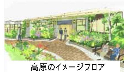
高原のイメージフロア