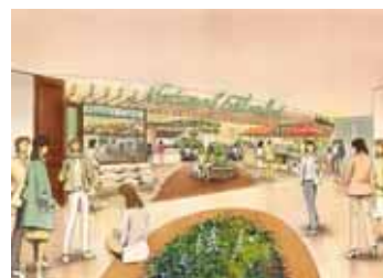
地階フードコート 「ナチュラルマーケット」

はーべすと・・・安心・安全な食材を使用した60種類の自然食料理をbuffe形式で楽しく選んでお召しあがりいただけます。明るい店内で気軽にご利用いただけます。