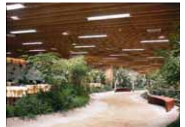
横浜店の『ダイニングパーク』は『海と緑』がキーワード