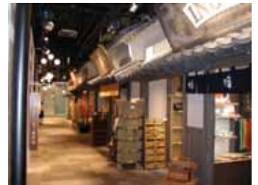
心齋橋本店の『こだわり趣味(和)の街』