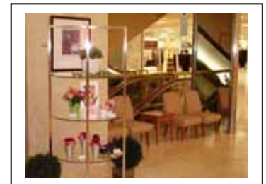
3階 シーティングスペース