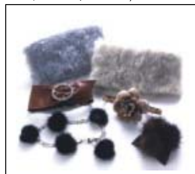
ブーツアクセサリ例

ブーツアクセサリ(別売り): 7型各2～5色=26種(牛革ベルト、ラインストーンベルト、ベルベットコサージュ、ラビットポンポン、フェイクファーなど)