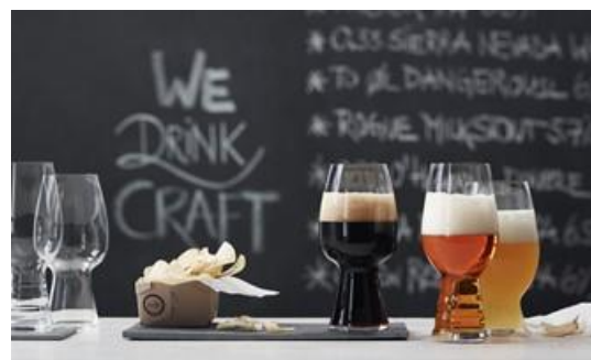
写真)クラフトビール・テイasting・キット(3 個入)5,400 円 ／シュピゲラウ

夕方、お家でゆっくりお酒を楽しむ「夕方おうちバル」を提案。ヘルシーなサラダや、赤ワインや紅いもののお酒など美容・健康に良いとされるレッドカラーのお酒で内側からキレイをサポート。また、食べ物をきれいに見せる食器や専用グラスなど「おうちバル」を充実させるアイテムをご用意いたしました。