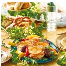
左)レストラン千草屋 鶏モモ肉オレンジ風味 & 苺とヨーグルトの冷製スープ (2種・各2個) 5,400円

「夏の醍醐味 ヨーグルト」をテーマに、ヨーグルトそのものだけでなく、ヨーグルトを様々なかたちで使用した商品をクローズアップしています。「ヨーグルト×スパイス」、「ヨーグルト×スイーツ」、「ヨーグルト×旨み」の切り口でご提案いたします。ヨーグルトが隠し味になっている、有名シェフ監修の料理は、大皿に盛りつければ写真映えもよく、パーティーシーンにも対応できます。