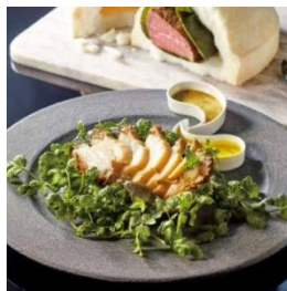
右)岡山浜作 あわび・牛肉 ヨーグルト 朴葉包み塩釜焼 (2種、各1個) 10,800円