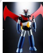
■超合金魂 GX-70 マジンガー-Z D.C. 14,040 円【限定 18 点】