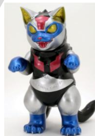
■KONATSU/ 大王ネゴラ マジンガーVer. 9,504 円【限定 70 体】