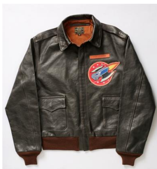
■TOYS McCOY/ TYPEA-2 MAZINGER Z “MAGIN GO!!” 599,400 円【限定 2 点】

世界で活躍する玩具・クリエイターやファッションデザイナー（ブランド）、さらに工芸職人から現代美術作家まで永井豪をリスペクトするアーティストが、永井豪作品に自らの感性を融合したアートな商品を作成。また、現在も根強い人気を誇るバンダイ超合金から人気ホビーメーカーメディコム・トイのソフビ人形など、オフィシャルなグッズも出品され、総数 500 種類以上、約 15,000 点のスケールで展開いたします。さらに、新作超合金クリエイターカスタム作品、歴代人気ホビーの 500 体に及ぶ展示、50 周年を記念した新作特報コーナーなど、見て楽しむコーナーも設置。コアファンから、ライトファンまで楽しめる永井豪ワールドが西武池袋本店に期間限定で登場いたします。