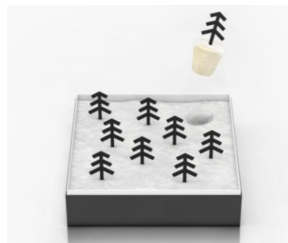
<9月販売予定:「neyuki」 価格未定>

ミュージックセキュリティーズのファイナセンスは、地場産業のモノづくりに対し、デザインのセンスを事業成長の足がかりに、資金調達をサポートしてまいります。そごう・西武は従来の品ぞろえの枠を越え、地域産品の販路拡大に連携してまいります。