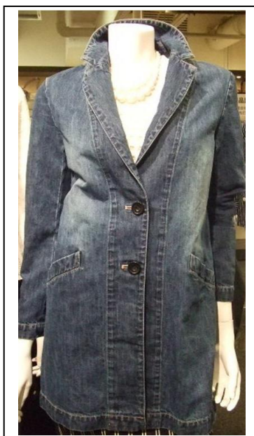
【ルジュールブライル】 コート 27,000 円 そごう・西武限定の フレンチリネンデニム を使用 (レディース)

展開期間 2015年2月17日(火)～3月16日(月) / 展開店舗 そごう・西武全24店舗