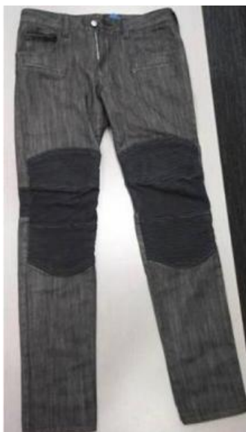
レザーコンビデニム (メンズ/レディース)

【リミテッドエディション】 デニム 29,000 円 ヒザと内腿に洗えるスエードを施した大人のバイカーデニム 展開店舗／ 西武池袋本店 渋谷店、 そごう横浜店 *レディースは池袋本店、渋谷店のみ