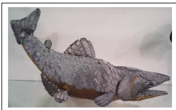
【KINUU プロジェクト】「デニジャケット」100,000 円

デザイナー衣田雅幸氏が服の残布や端布を使って動物をつくるエコロジーアート。今回はクロキの端布で鮭に挑戦。ラメ入りデニムで鮭独特のディテールまで表現。 ※特別制作につき限定1点。展開店舗 / 西武池袋本店