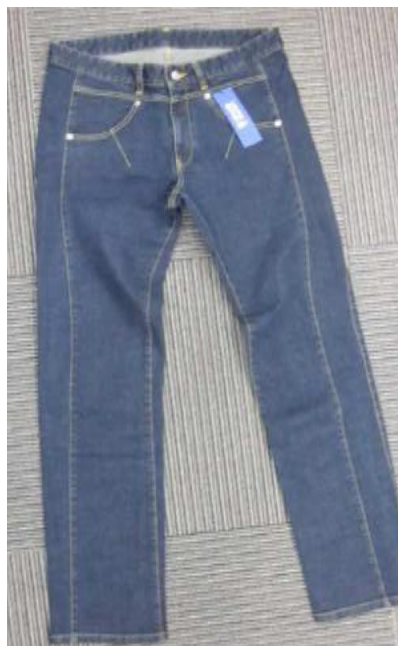
動体裁断デニム (メンズ)

【リミテッドエディション】 デニム 16,000 円 クロキの独特の風合い生地に動体裁断技術を施した初のデニム