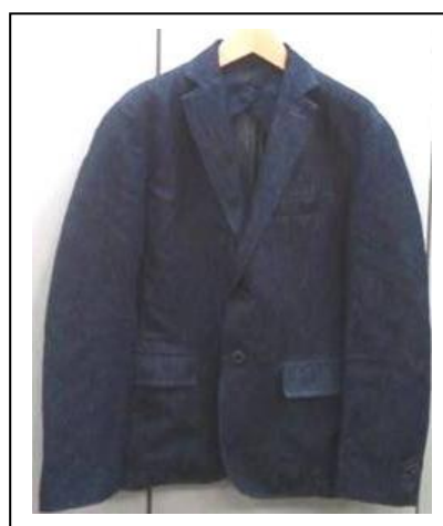
【リミテッドエディション】 ジャケット 26,000 円 そごう・西武限定の アイリッシュリネン デニムを使用 (メンズ)

デザイナー衣田雅幸氏が服の残布や端布を使って動物をつくるエコロジーアート。今回はクロキの端布で鮭に挑戦。ラメ入りデニムで鮭独特のディテールまで表現。 ※特別制作につき限定1点。展開店舗 / 西武池袋本店