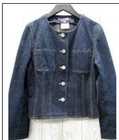
【アベックモード】 ジャケット 21,000 円 スーピマコットン を使用した上品な ストレッチデニム (レディース)