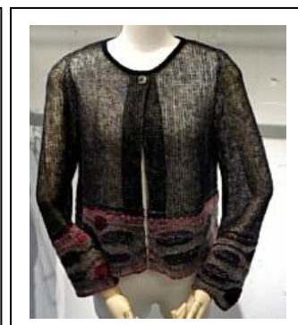
《オンシーズン：ニット》