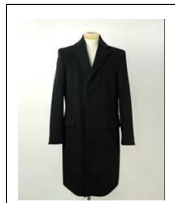
《ジャパンメイド：カシミアコート》

・・・日本唯一のカシミア一貫工場の上質カシミア素材をクローズアップ 婦人「モードプラス/オンシーズン」カシミアニット・・・デザイン性/カラー配色に特徴 展開店舗：モードプラス：西武池袋本店、渋谷店／そごう横浜店、千葉店、 神戸店、広島店、大宮店 オンシーズン：そごう千葉店、神戸店、広島店ほか10店舗 価格帯：16,000～29,000円 展開時期：10月上旬～ 紳士ジャパンメイドカシミアコート・・・独自のダブルフェイス縫製 展開店舗：西武池袋本店、そごう横浜店他、15店舗(予定) 価格帯：120,000円 展開時期：10月末～(予定)