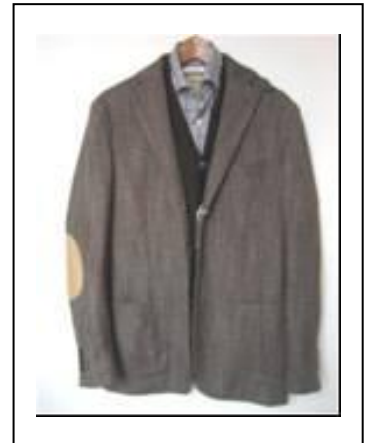
《リミテッドエディションカジュアル: ジャケット》