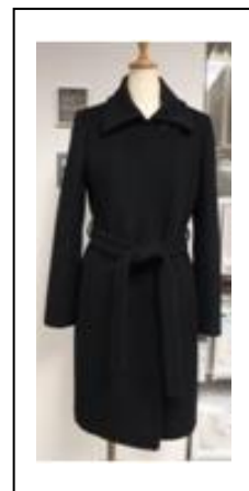
《キャリアキャラクター：コート》