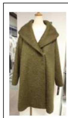
《モードプラス：コート》

・・・ウールコート地のからみ織にかけては世界屈指の技術を誇る 婦人「モードプラス」・・・今年らしいボリュームシルエットコート 展開店舗：西武池袋本店、渋谷店／そごう横浜店、千葉店、 神戸店、広島店、大宮店(以上基幹店7店舗) 価格帯：49,000～65,000円 展開時期：10月下旬～ 婦人キャリアキャラクター売場 展開店舗：西武池袋本店／そごう横浜店、千葉店、 神戸店、広島店、大宮店(以上基幹店6店舗) 価格帯：39,000～65,000円 展開時期：10月下旬～