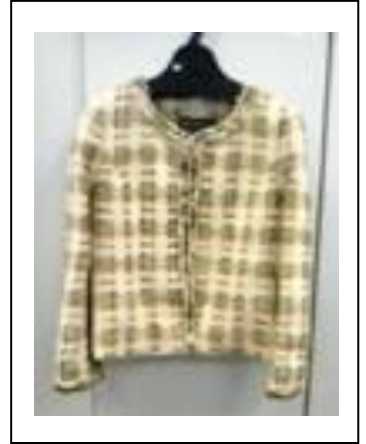
《キャリアキャラクター: ジャケット》