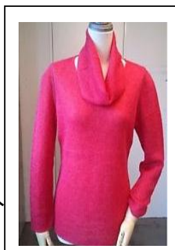
《モードプラス：ニット》

・・・国内ニッター「佐藤繊維」との取り組み、2年目の進化 婦人「モードプラス」ニット・・・昨年大好評のモヘアを拡大展開 展開店舗：西武池袋本店、渋谷店／そごう横浜店、千葉店、 神戸店、広島店、大宮店(以上基幹店7店舗) 価格帯：7,000～21,000円 展開時期：10月上旬～ 婦人「オンシーズン」ニット・・・平場強化に向け「モヘア&紺」を投入 展開店舗：そごう千葉店、神戸店、広島店ほか10店舗展開 価格帯：8,000～20,000円 展開時期：10月上旬～