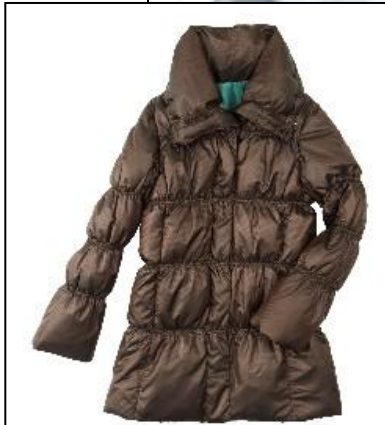
■ダウンコート 18,690 円 ※9 月下旬入荷予定