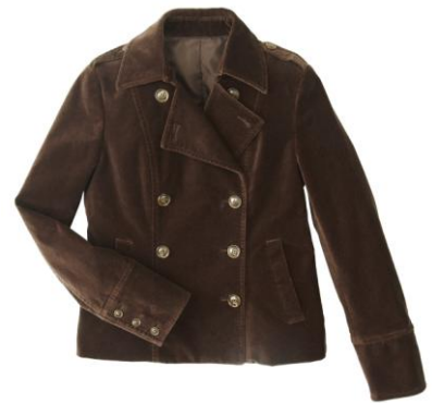
■P ジャケット 11,550 円 ※9 月初旬入荷予定