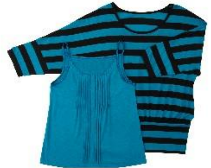
■ボーダーカットソー 3,990 円 ■キャミソール 2,730 円 ※9 月初旬入荷予定