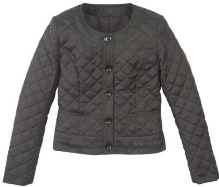
■キルティングジャケット 8,190 円 ※9 月初旬入荷予定