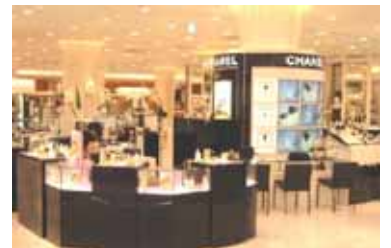
上段；シャネル、下段；パークレー