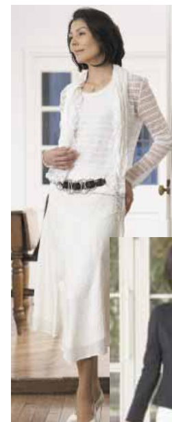
ギャバジンKT ミッシェルクラ

～マグレブ、自由区、レキップ、マイケルマイケルコース、トゥビーシック、7IDコンセプト、ギャバジンKTなど人気7ブランドを導入。