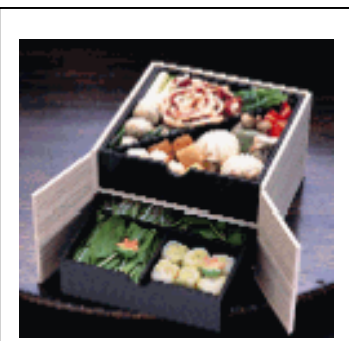
人気の鍋・「権太呂 本鴨・京野菜重ね鍋」 万原産種・国内飼育の本鴨を選び、旬の京野菜や生麩、湯葉などの美味しい具材の人気鍋(税込10,500円)