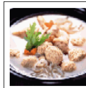
ごっつお便・Cコース(10,500円非課税) 1830年の創業以来、日本の食文化をリードしてきた「なだ万」の三河赤鶏と鶏鍋(3~4人前)