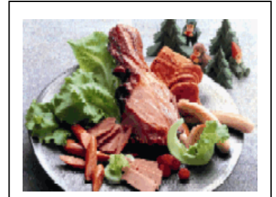
食源探訪・「ドイツソーセージ紀行 アルペン街道のソーセージ」 南ドイツのアルペン街道沿いのリフト地に伝わる5種類のソーセージ(税込5,250円)