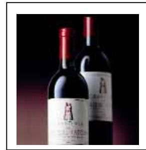
極上のこだわり・ 「シャトー・ラトゥール1982&1990 2本セット」 各720ml、30セット限定(税込262,500円)

お取り寄せブームで各地方の名産品が人気ですが、この冬は全国の自慢のお鍋をご自宅で手軽に召し上がっていただけるギフトをご用意しました。クリスマスやお正月に家族や友人と鍋を囲み、絆を深めれば、心も体も暖まります。今年の冬はお部屋の暖房を少し低く設定してお鍋を食べるウォームフードをおすすめします。