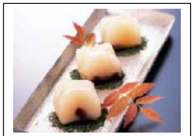
健康家族御用達・「京はやしや 冬の彩り」 寒天入り栗と大納言のゼリー、お茶のクッキー、お茶のツートンケーキのセット(税込3,150円)