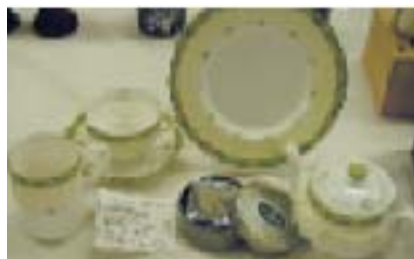
＜ミントン＞復刻洋食器セット ミントン保有の画帳から1933年デザインのティーウェアをパターンで復刻。