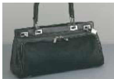
＜ランセル＞牛革バッグ 1930年代復刻版シリーズにハラコ素材を組み合わせた心齋橋オリジナル。