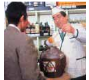
焼酎アドバイザー