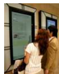
ふれてビジョン（イメージ）