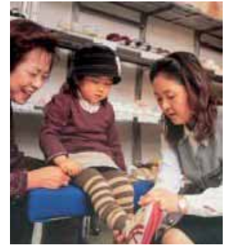
シューフィッターによる足の計測