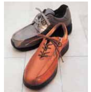
ウォーキングショップ

<専門販売員>フォーマルスパシャリスト、フィッティングアドバイザー、ギフトアドバイザー