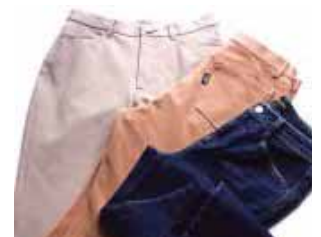
5号~17号までサイズが豊富に揃うパンツショップ

西武・そごうオリジナル商品の品揃えを充実し、上質マチュア向けの機能パンツを5号から17号まで取り揃えた、サイズと機能に拘った売場となります。また新たに、大人のデニムを拡大展開いたします。