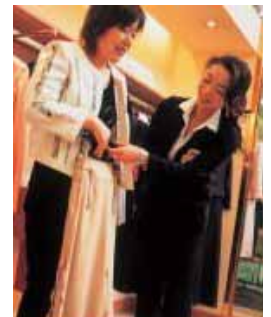
小さいサイズ 大きいサイズ が充実