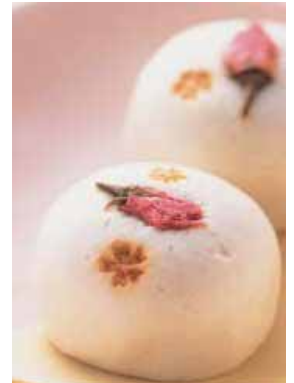
県内初登場 花園万頭